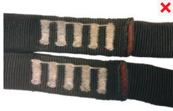
etiquetas de identificación desaparecidas